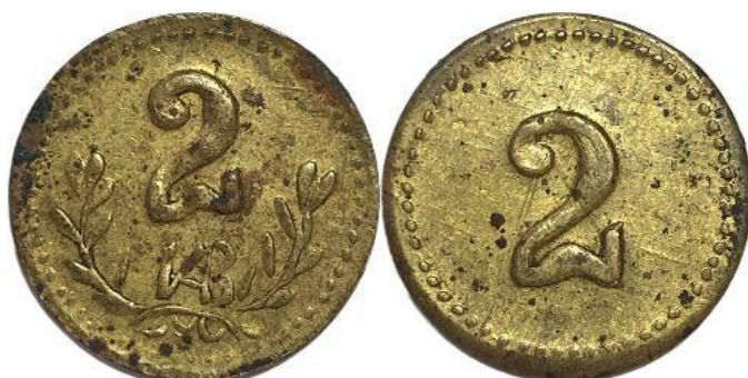
Металл – Латунь Диаметр (мм) – 16,5 Вес (г) – 1,41 Гурт – гладкий