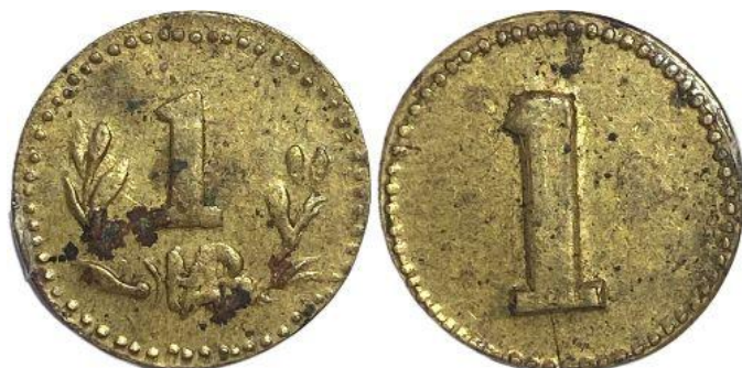
Металл – Латунь Диаметр (мм) – 15 Вес (г) – 1,08 Гурт – гладкий

Жетоны изготавливались из латуни и отличались лаконичным, но выразительным дизайном: на лицевой стороне указывался номинал, окружённый лавровыми или оливковыми ветвями и инициалами „АЗ“, на оборотной — только номинал с кантом из точек. Эти знаки выполняли функцию внутренней валюты в пределах хозяйственной империи Азмановых, обеспечивая стабильность оборота и независимость от перебоев в государственном денежном снабжении.