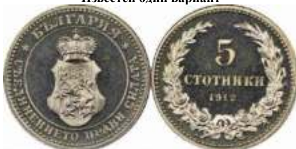
5 стотинки 1912 "PROOF" Известен один вариант