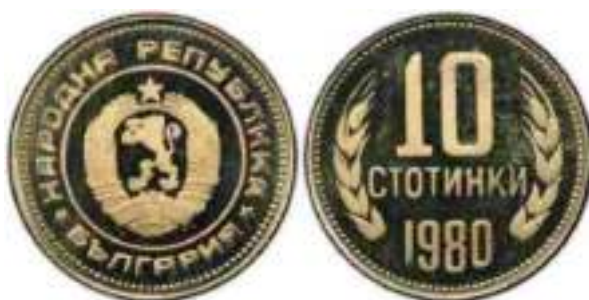
1980 "PROOF" Известен один вариант