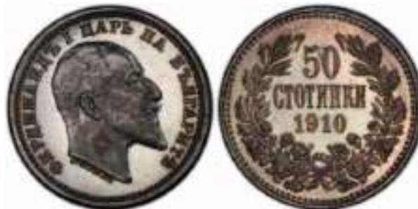
50 стотинки 1910 “PROOF”

Аверс – буква “Н” в слове “НА” без перемычки