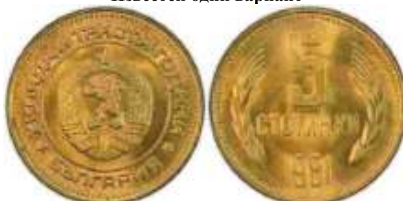
1981 "1300 лет Болгарии" Известен один вариант