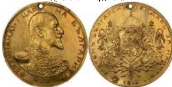
4 Дуката 1914 Фердинанд I

Легенда для Александра II Российского. Отчеканена Фердинандом I