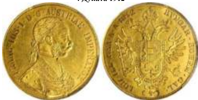
4 Дуката 1912

Реверс - ЗЛАТЕНЬ БЪЛГАРСКИ ПЕНДАРЪ ЗА НАКИТЬ * 1912 *