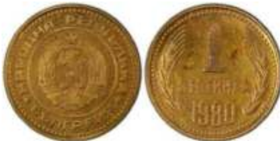
1980 Известен один вариант