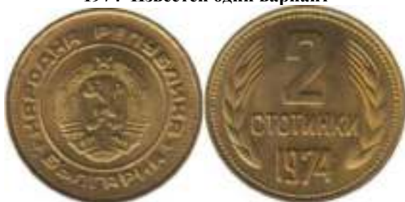
1974 Известен один вариант