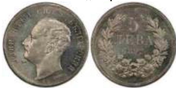
5 Лева 1892 Известен один вариант