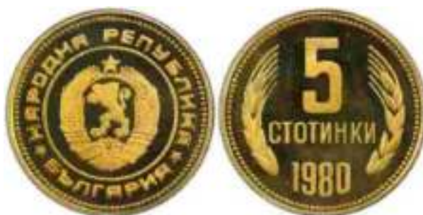
1980 "PROOF" Известен один вариант