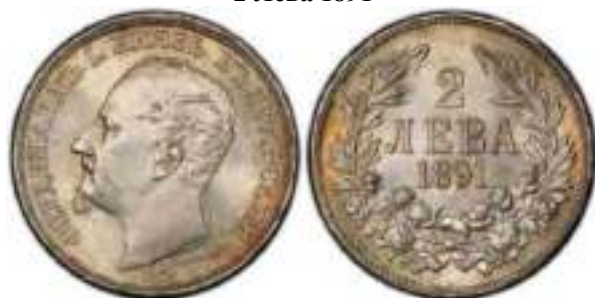
2 Лева 1891