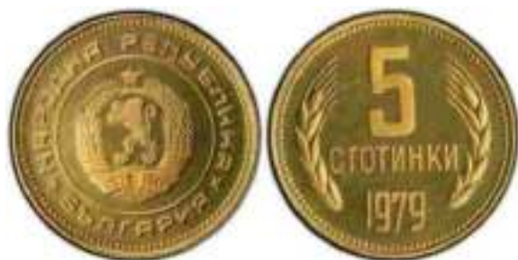
1979 "PROOF" Известен один вариант