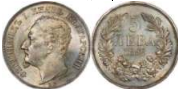
5 Лева 1892 "PROOF" Известен один вариант