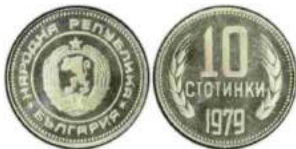
1979 "PROOF" Известен один вариант