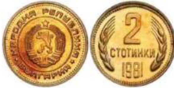
1981 "Народная Республика Болгария" "PROOF". Известен один Вариант