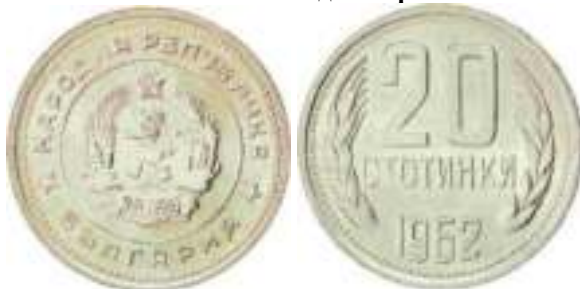
1962 Известен один вариант