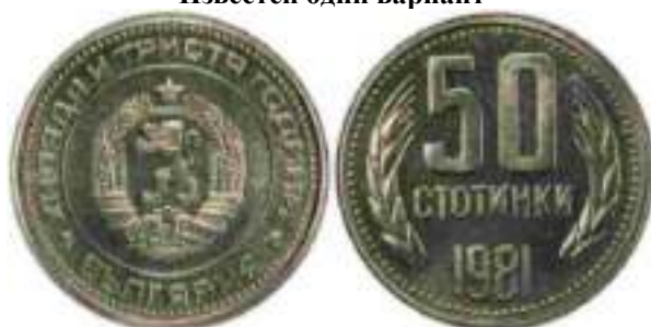
1981 "1300 лет Болгарии" "PROOF" Известен один вариант