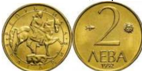
2 лева 1992 Известен Один Вариант