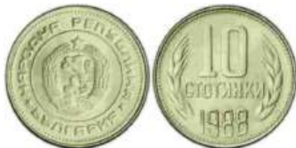
1988 Известен один вариант