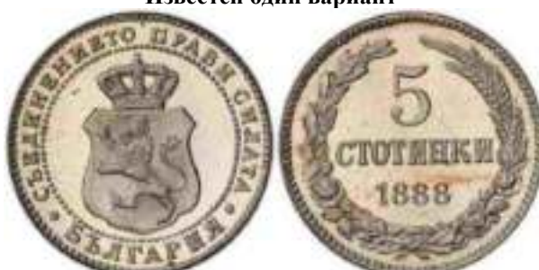
5 стотинки 1888 "PROOF" Известен один вариант