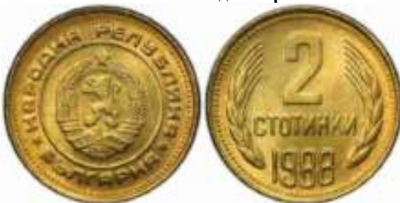
1988 Известен один вариант