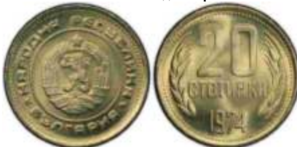
1974 Известен один вариант