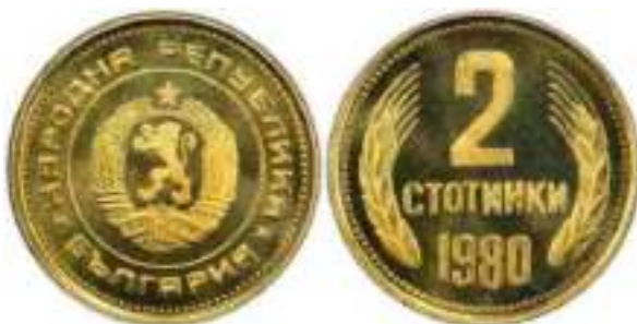
1980 "PROOF" Известен один вариант