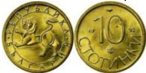
10 стотинки 1992 Известен Один Вариант