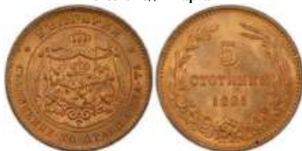
5 стотинки 1881 Известен один вариант