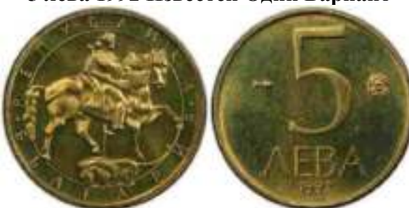
5 лева 1992 Известен Один Вариант