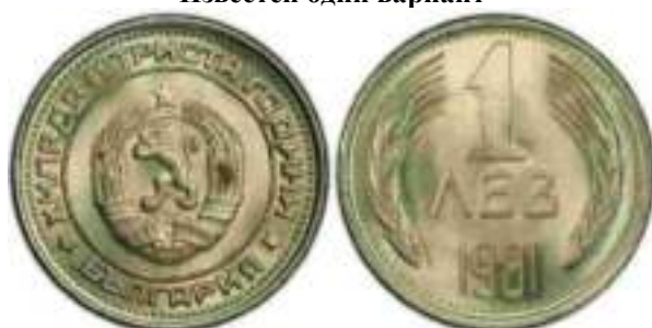
1981 "1300 лет Болгарии" Известен один вариант