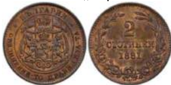
2 стотинки 1881 Известен один вариант