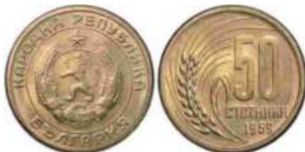
1959 Известен один вариант