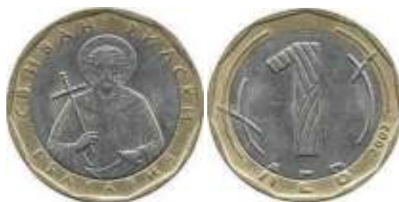
1 Лев 2002 Известен един вариант