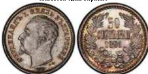
50 стотинки 1891 "PROOF" Известен один вариант