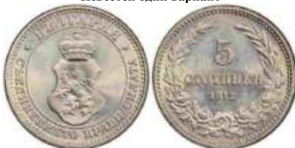
5 стотинки 1912 Известен один вариант