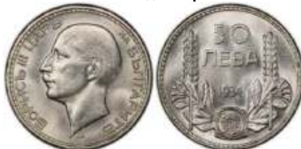
50 Лева 1934 Монетный двор Белград, Югославия. Лондон, Великобритания Известен Один Вариант