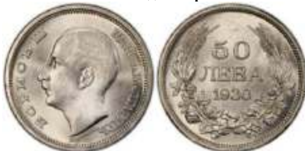
50 Лева 1930 Монетный двор Будапешт, Венгрия. Известен Один Вариант