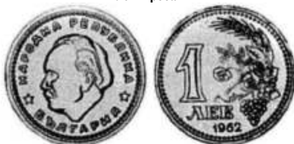
1962 Проба 1