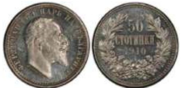
50 стотинки 1910 "PROOF"

Аверс – буква "Н" в слове "НА" с перемычкой. Перемычка толстая