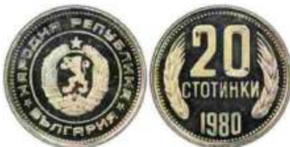
1980 "PROOF" Известен один вариант