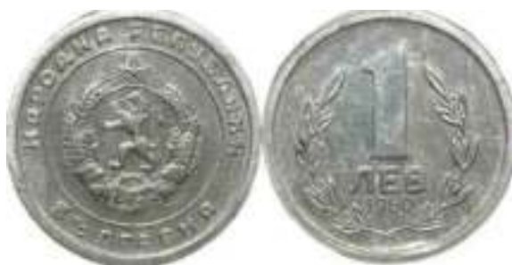
1960 Проба 1