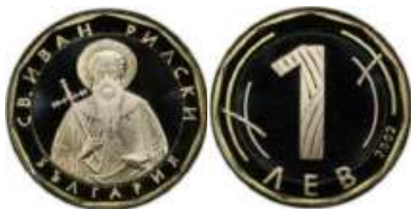
1 Лев 2002 “PROOF” Известен един вариант