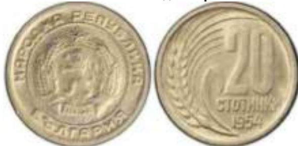
1954 Известен один вариант