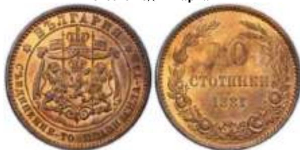
10 стотинки 1881 Известен один вариант