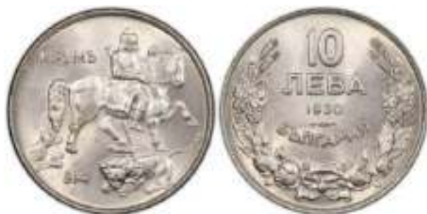
10 Лева 1930 Монетный двор Штутгарт, Германия.