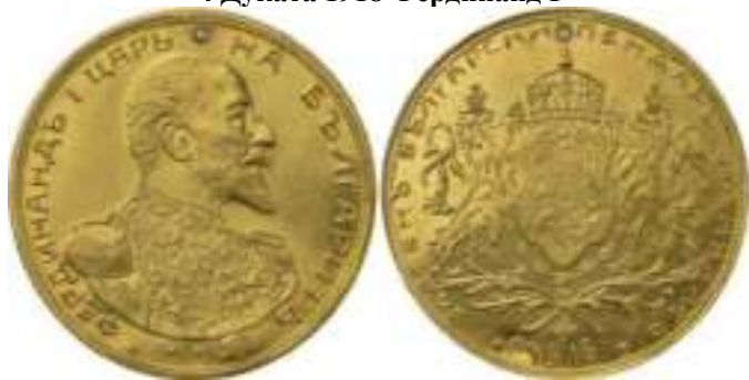
4 Дуката 1918 Фердинанд I

Реверс - ЗЛАТЕНЬ БЪЛГАРСКИ ПЕНДАРЪ ЗА НАКИТЬ * 1917 *