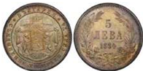
5 Лева 1884 Известен один вариант