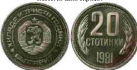
1981 "1300 лет Болгарии" "PROOF" Известен один вариант