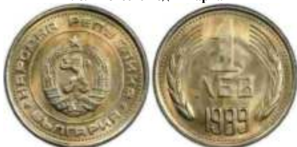
1989 Известен один вариант