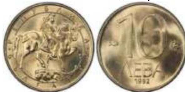
10 лева 1992 Известен Один Вариант