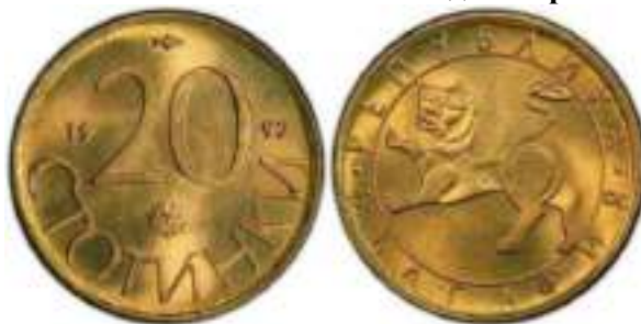
20 стотинки 1992 Известен Один Вариант