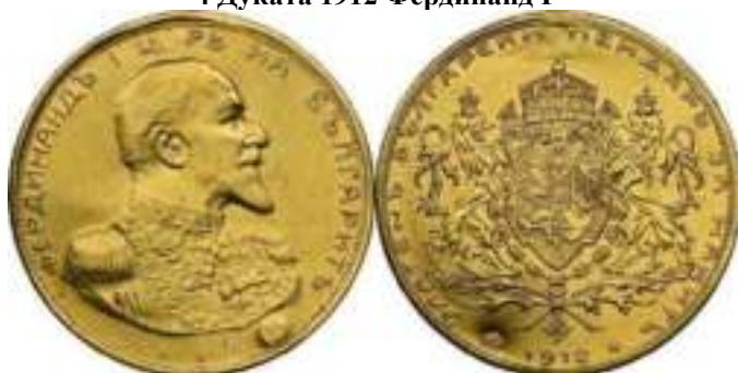
4 Дуката 1912 Фердинанд I