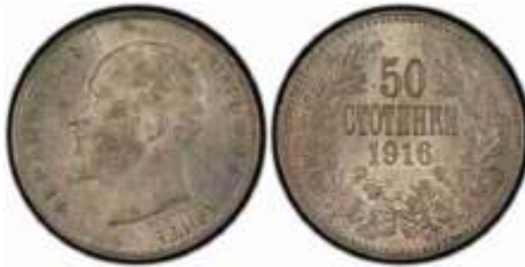
50 стотинки 1916