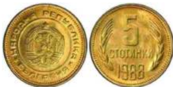
1988 Известен один вариант