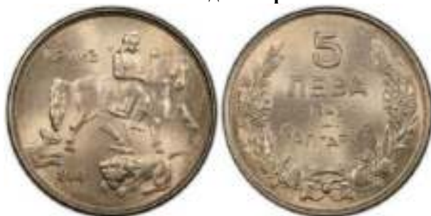
5 Лева 1943 Монетный двор Вена, Австрия. Известен Один Вариант