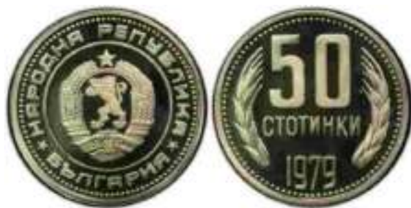
1979 "PROOF" Известен один вариант