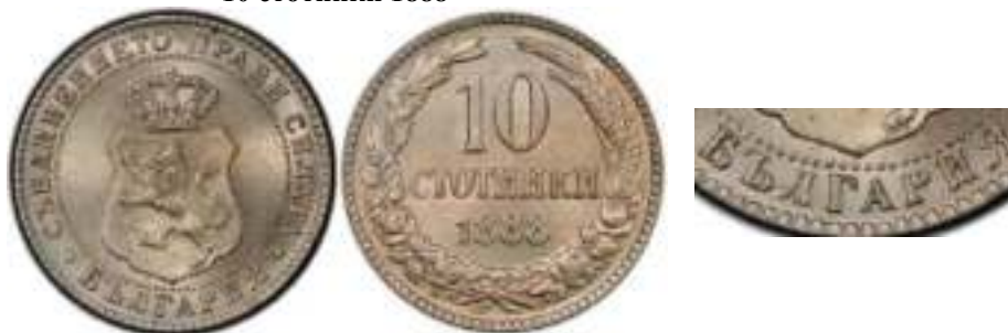
10 стотинки 1888

Аверс – В слове “БЪЛГАРИЯ” буква “P” открыта сверху