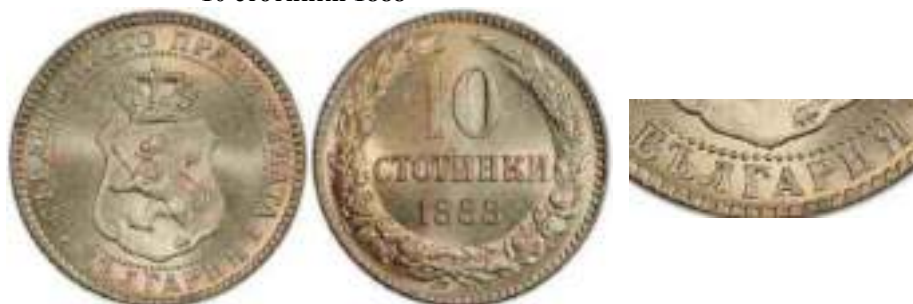
10 стотинки 1888

Аверс – В слове “БЪЛГАРИЯ” буква “P” закрыта