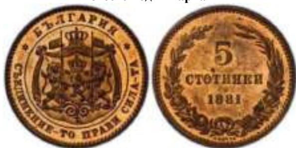
5 стотинки 1881 "PROOF" Известен один вариант