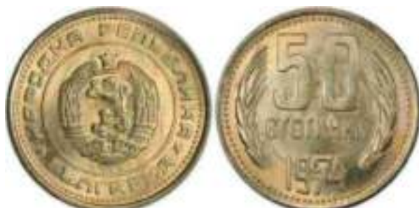
1974 Известен один вариант