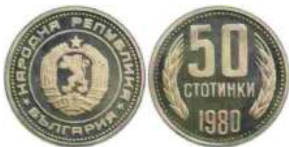
1980 "PROOF" Известен один вариант