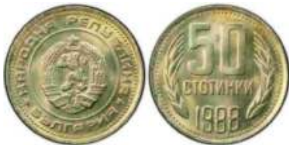
1988 Известен один вариант