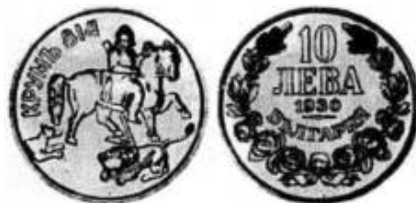
10 Лева 1930 Монетный двор Штутгарт, Германия. Проба