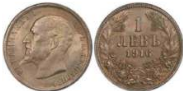
1 Лев 1916