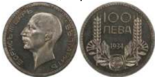
100 Лева 1934 Монетный двор Белград, Югославия. Лондон, Великобритания. Известен Один Вариант "PROOF"