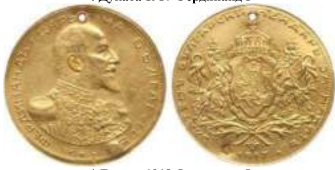
4 Дуката 1917 Фердинанд I

Реверс - ЗЛАТЕНЬ БЪЛГАРСКИ ПЕНДАРЪ ЗА НАКИТЬ * 1914 *