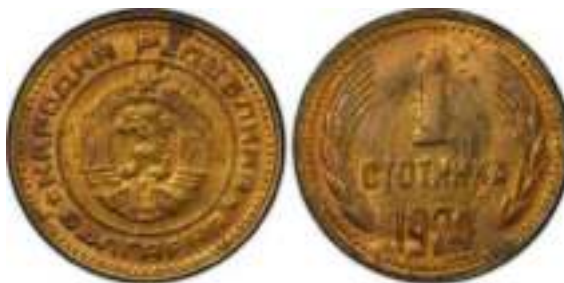
1974 Известен один вариант