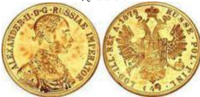
4 Дуката 1878