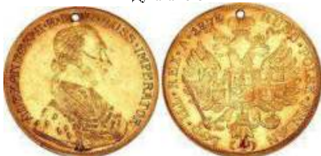
4 Дуката 1875