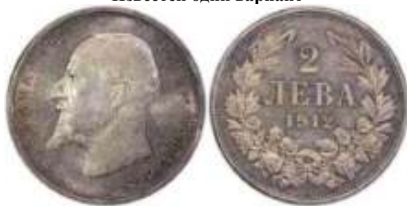
2 Лева 1912 Известен один вариант