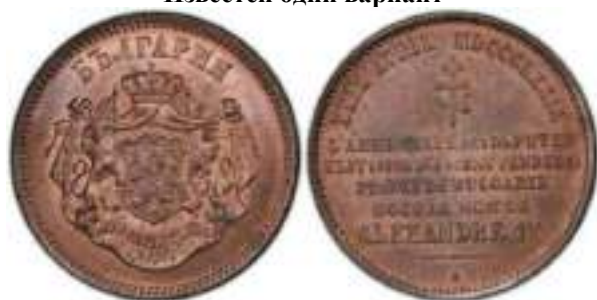
10 сентим 1879 Известен один вариант