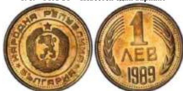
1989 "PROOF" Известен один вариант