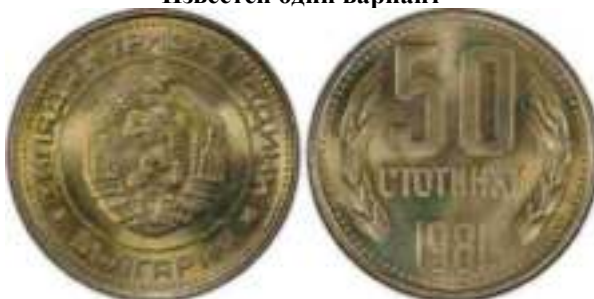
1981 "1300 лет Болгарии" Известен один вариант