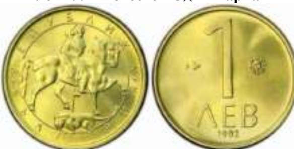
1 лев 1992 Известен Один Вариант