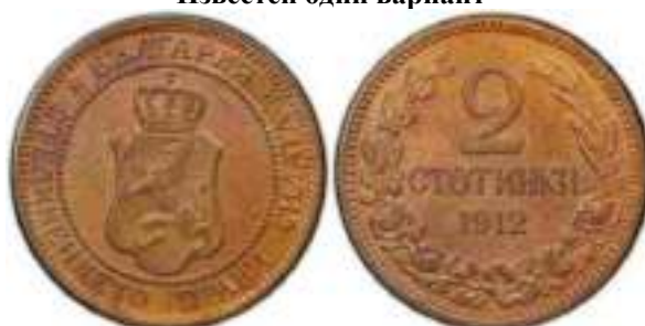
2 стотинки 1912 Известен один вариант

Реверс – лист колоса перекрывает правую часть буквы "И"