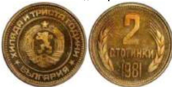
1981 "1300 лет Болгарии" "PROOF" Известен один вариант