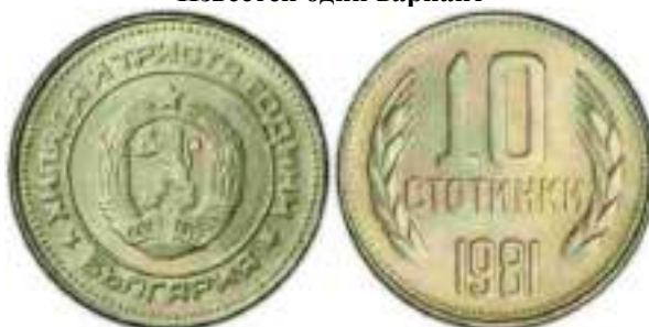
1981 "1300 лет Болгарии" Известен один вариант