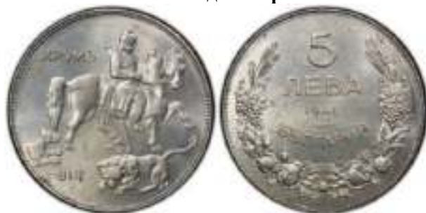
5 Лева 1941 Монетный двор Вена, Австрия. Известен Один Вариант