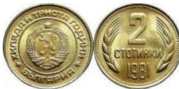
1981 "1300 лет Болгарии" Известен один вариант