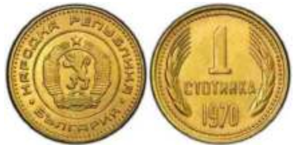
1970 Известен один вариант