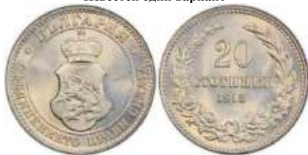
20 стотинки 1912 Известен один вариант