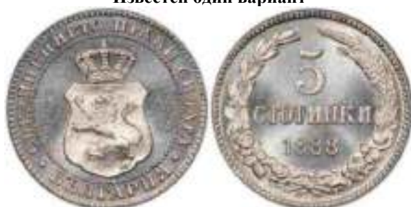
5 стотинки 1888 Известен один вариант