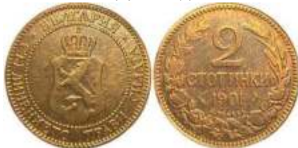
2 стотинки 1901

Реверс – лист колоса не перекрывает правую часть буквы "И"