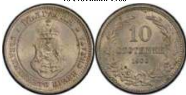
10 стотинки 1906