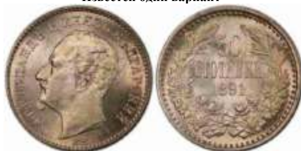
50 стотинки 1891 Известен один вариант