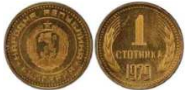
1979 Известен один вариант