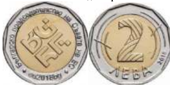
Известен един вариант