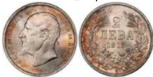
2 Лева 1913 Известен один вариант