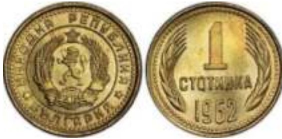
1962 Известен один вариант