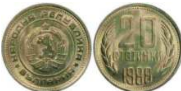
1988 Известен один вариант