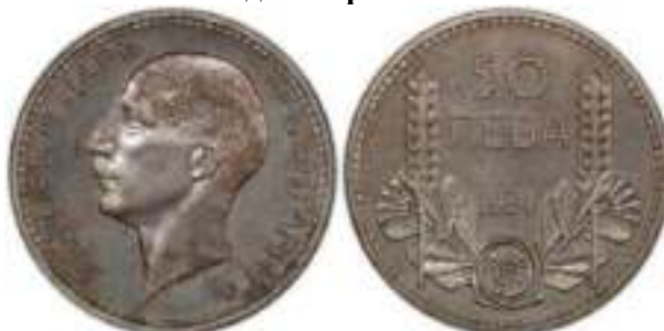
50 Лева 1934 Монетный двор Белград, Югославия. Лондон, Великобритания Известен Один Вариант "PROOF"