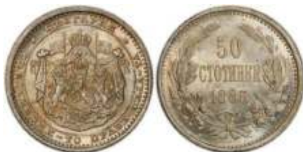
50 стотинки 1883 Известен один вариант