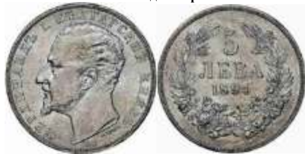
5 Лева 1894 Известен один вариант