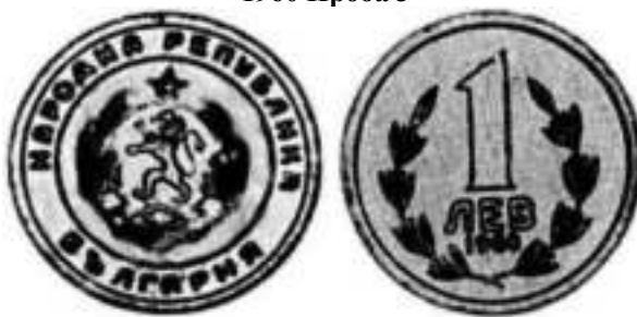
1960 Проба 3