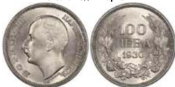
100 Лева 1930 Монетный двор Будапешт, Венгрия. Известен Один Вариант