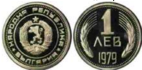
1979 "PROOF" Известен один вариант