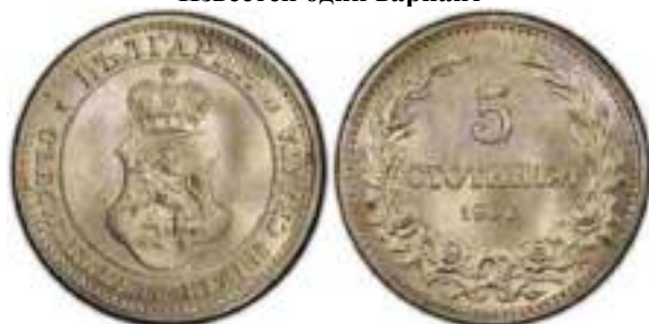
5 стотинки 1906 Известен один вариант