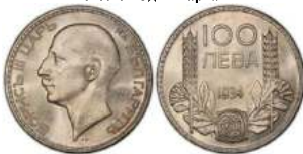
100 Лева 1934 Монетный двор Белград, Югославия. Лондон, Великобритания. Известен Один Вариант