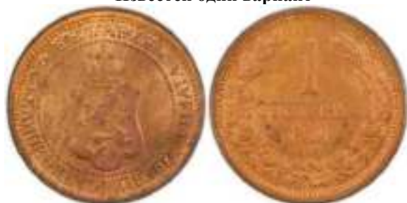
1 стотинка 1901 Известен один вариант