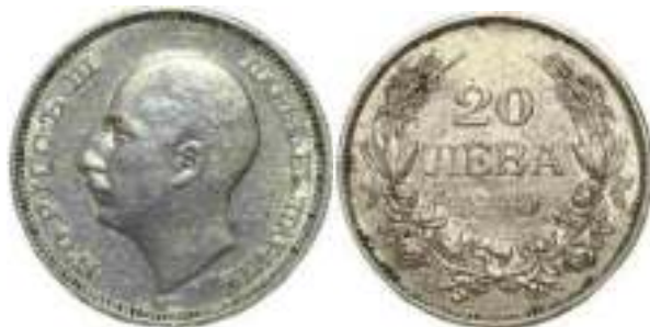
20 Лева 1940 Монетный двор Берлин, Германия

Аверс - Буква "А" маленькая, расположена по центру нижнего пика портрета