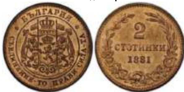
2 стотинки 1881 "PROOF" Известен один вариант