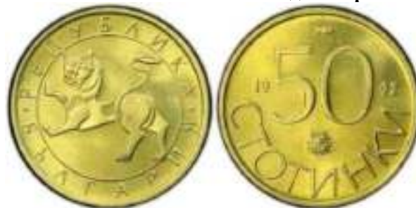
50 стотинки 1992 Известен Один Вариант