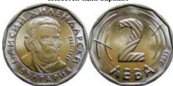
Известен един вариант