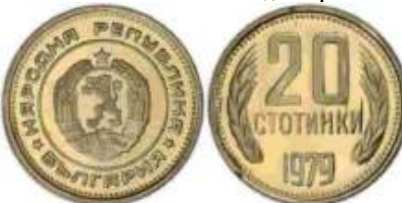
1979 "PROOF" Известен один вариант