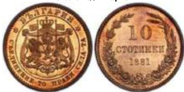
10 стотинки 1881 "PROOF" Известен один вариант