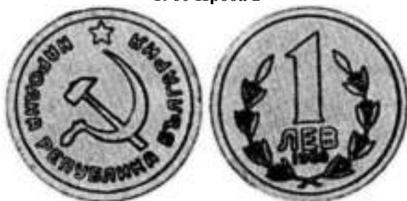
1960 Проба 2