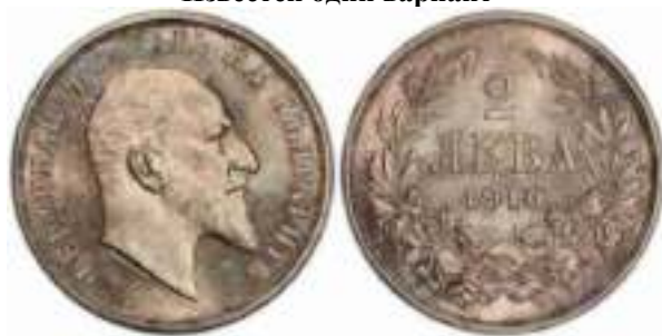
2 Лева 1910 Известен один вариант