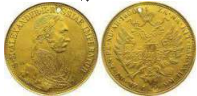
4 Дуката 1900