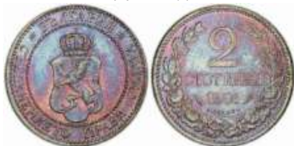
2 стотинки 1901