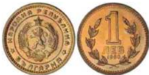
1960 Известен один вариант