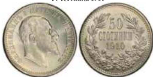
50 стотинки 1910