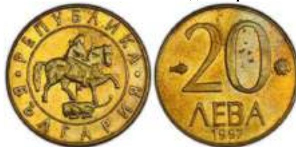
20 лева 1997 Известен Один Вариант