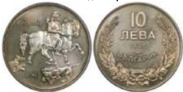
10 Лева 1930 Монетный двор Штутгарт, Германия. "PROOF" Известен Один Вариант