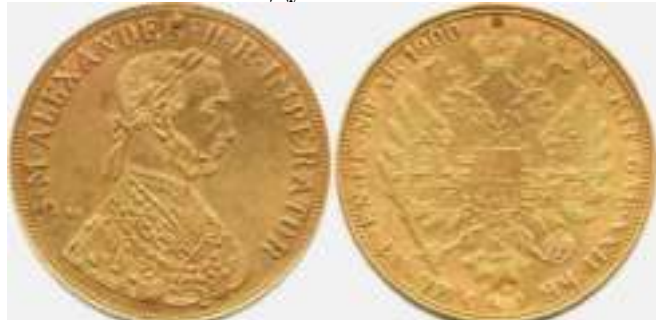
4 Дуката 1900