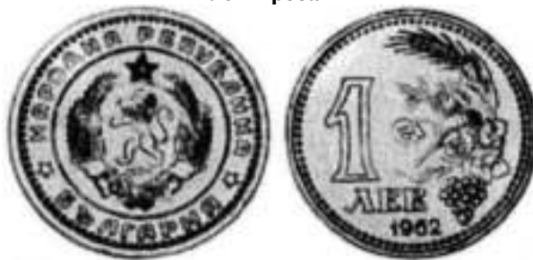
1962 Проба 2