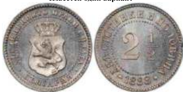
2 ½ стотинки 1888 Известен один вариант