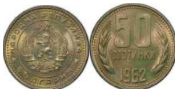
1962 Известен один вариант