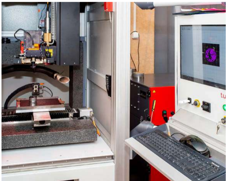
Станок для гравирования первичного инструмента будущих монет

Сейчас среди множества технологий, внедренных на монетном дворе, особенно выделяется лазерная технология. Она применяется в большинстве изделий, например, в монетах «Атомный ледокол "Сибирь"», «Сказка о царе Салтане», «300-летие Российской академии наук», «Б.Ф. Сафонов» и многих других. Полировка при дальнейшей лазерной обработке штемпеля необходима. А еще именно на этом этапе закладывается в монету качество «пруф» – визуально она выглядит как ровное зеркальное поле. И теперь отполированный штемпель попадает на лазерную установку. Но прежде чем приступить к нанесению изображения оператор задает программу обработки инструмента.