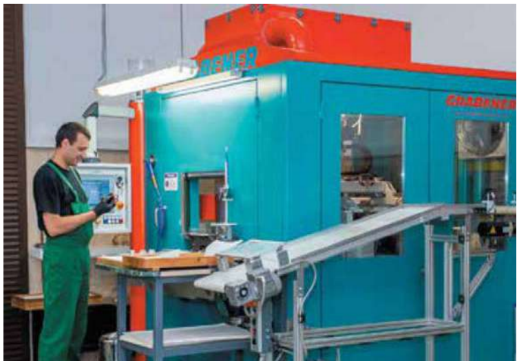
Чеканка современных монет на автоматическом прессе

Сейчас среди множества технологий, внедренных на монетном дворе, особенно выделяется лазерная технология. Она применяется в большинстве изделий, например, в монетах «Атомный ледокол "Сибирь"», «Сказка о царе Салтане», «300-летие Российской академии наук», «Б.Ф. Сафонов» и многих других. Полировка при дальнейшей лазерной обработке штемпеля необходима. А еще именно на этом этапе закладывается в монету качество «пруф» – визуально она выглядит как ровное зеркальное поле. И теперь отполированный штемпель попадает на лазерную установку. Но прежде чем приступить к нанесению изображения оператор задает программу обработки инструмента.