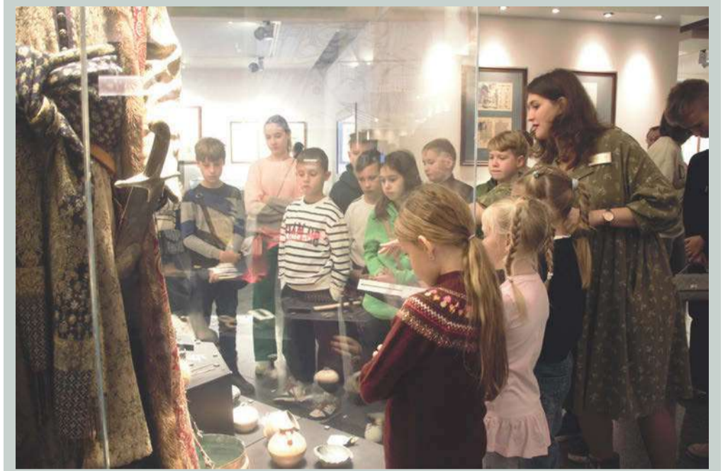
Но вначале – азы. Как и зачем появились деньги. И первые экспонаты музея – монеты.