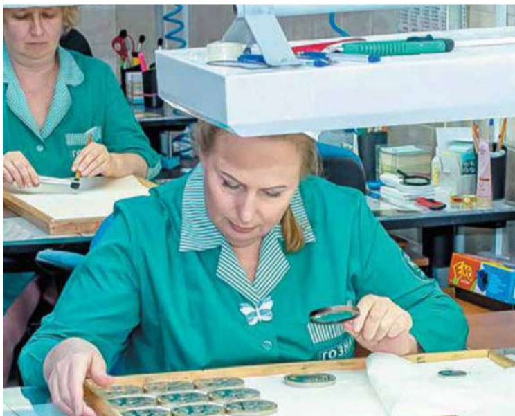
Контроль качества готовых монет

И вот – чеканка, то есть тиражирование монеты. Наладчик укладывает в оборудование штемпели (их два – лицевая и оборотная стороны монеты. – Прим.) и заготовки. «Чистка» заготовок – это тоже обязательный этап производства монет. После галтовки и промывки чистейшие заготовки укладываются в кассеты – в этом виде они подаются в чеканочный пресс. Нужно монете придать дополнительный блеск? Тогда в работу вступают гальваники. Они обрабатывают поверхность изделий таким образом, что порой сложно догадаться, из какого на самом деле металла сделана монета.