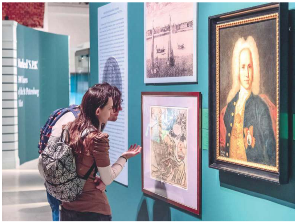
Посетители выставки изучают карту Санкт-Петербурга