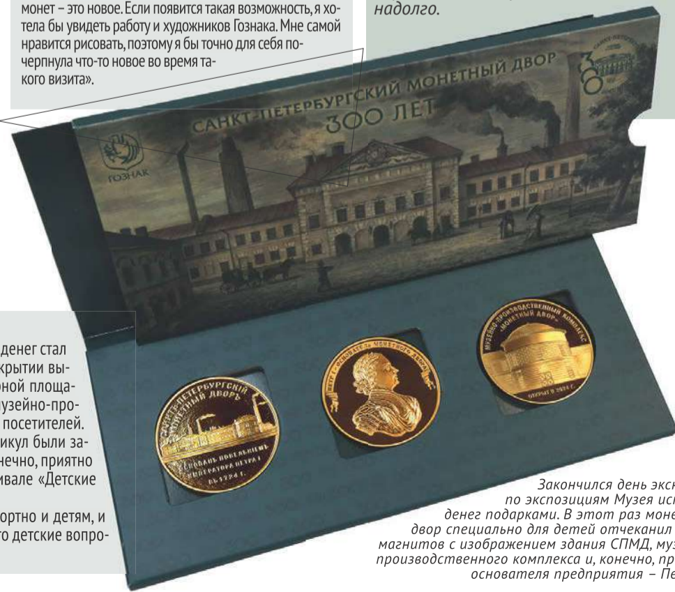
Закончился день экскурсий по экспозициям Музея истории денег подарками. В этот раз монетный двор специально для детей отчеканил набор магнитов с изображением здания СПМД, музейно-производственного комплекса и, конечно, профиля основателя предприятия – Петра I.