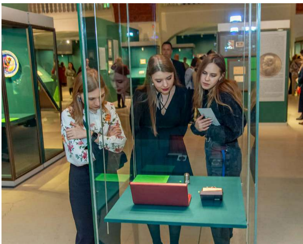
На выставке представлены наиболее интересные экспонаты из фондов Государственного Эрмитажа, Российской национальной библиотеки и АО «Гознак», посвященные работе СПМД

– Я и мои коллеги от души поздравляем коллектив Санкт-Петербургского монетного двора с 300-летием и желаем удачи, здоровья, творческих успехов. Убежден, что монетный двор будет существовать еще много-много столетий, и у нас будет достаточно поводов для встреч и создания новых совместных проектов. Поздравляю!