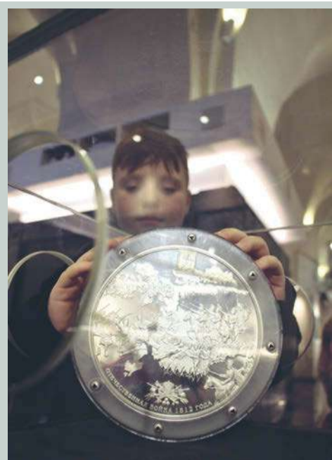
А вот и еще одна гордость музея – пятикилограммовая монета из серебра. Достать ее из короба невозможно, но потрогать – не возбраняется