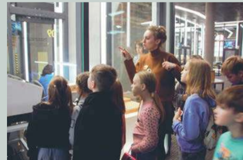
Производство монет – непростое, но захватывающее зрелище.