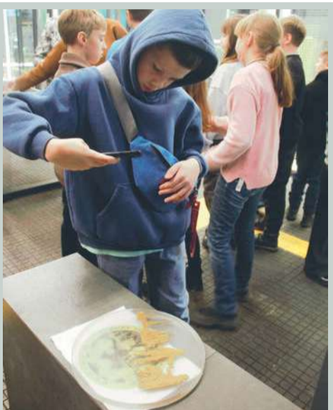
Снимки лепки – на память.

В следующем году мы вновь будем организовывать для детей конкурсы и экскурсии. Пока планы не утверждены, скажу лишь так: нам есть чем удивить и заинтересовать ребят, тем более что о монетном дворе и его работе они уже знают».