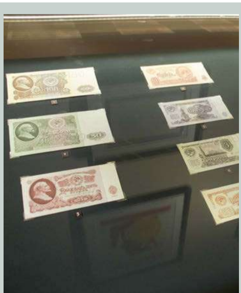
Советское время. И образ вождя на банкнотах.