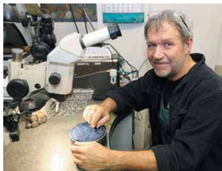
Гравировка маточника будущей монеты

Нарисовать модель в 3D-программе недостаточно – нужно дополнительно прописать параметры и характеристики изделия. На эти данные будут опираться все участвующие в производстве монеты работники.