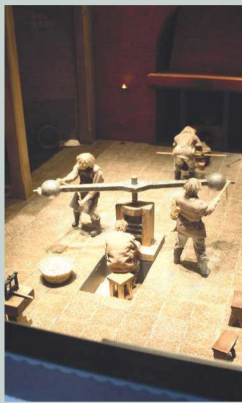
А вот и динамический макет монетного двора XVIII века. Маленькие человечки разыграли перед ребятами спектакль – как чеканились монеты в древности. Представление настолько увлекло детей, что экскурсоводу приходилось периодически просить юных зрителей отойти от стекла.