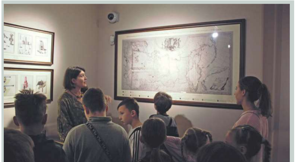
Теперь перелетаем на Урал, ведь медь для чеканки монет добывали именно там.