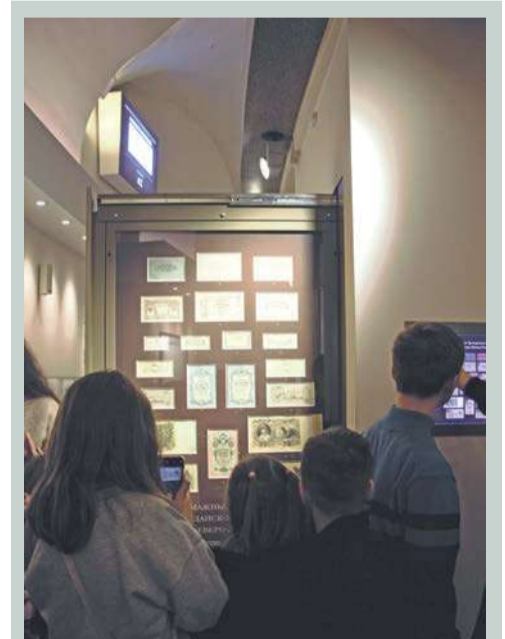
Царские деньги считаются одними из самых красивых в мире. Юные экскурсанты с этим согласны – и фото на память.