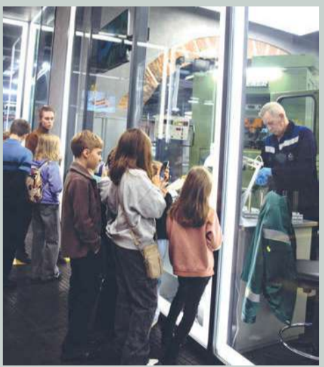
Проверить качество чеканки монет – дети готовы!