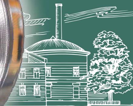
Трехкилограммовая серебряная монета Банка России «300-летие Санкт-Петербургского монетного двора» номиналом 200 рублей