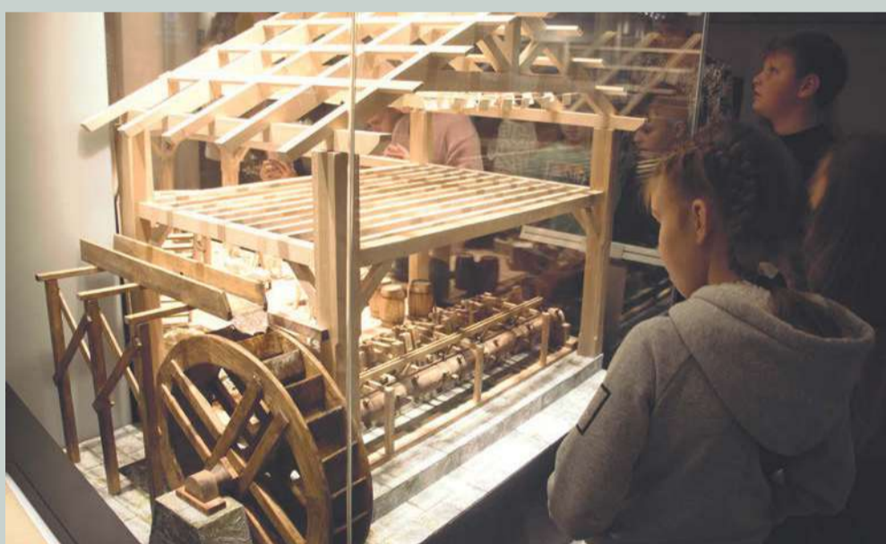
А следом попадаем в эпоху начала печатания бумажных денег. И снова – динамический макет. На этот раз «работники» бумажной фабрики отливают на глазах у детей бумагу.