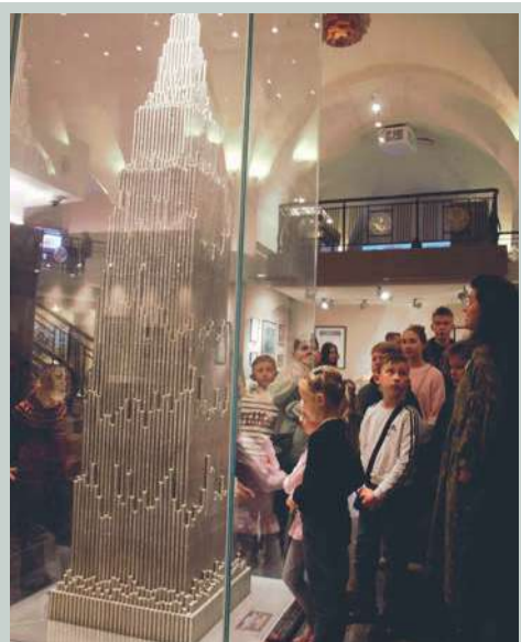
Пожалуй, главный по мнению посетителей экспонат музея – миллион во всей красе. Фотосессии на фоне башни начинаются с первых минут открытия площадки и заканчиваются лишь перед самым ее закрытием.