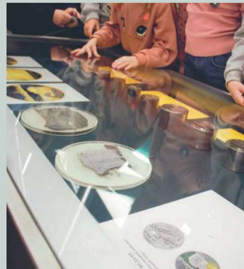
Основа основ – превращение эскиза в инструмент для чеканки.