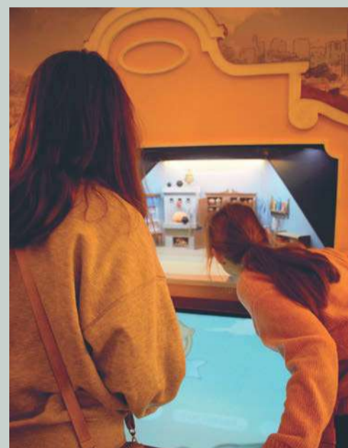
Перед тем как покинуть музей, у ребят было немного свободного времени. И конечно, оно было потрачено на знакомство с экспонатами. Одни решили заглянуть в гости к медвежонку Гуртику – волшебному хранителю Музея истории денег, другие – получше рассмотреть защитные признаки на современных банкнотах.