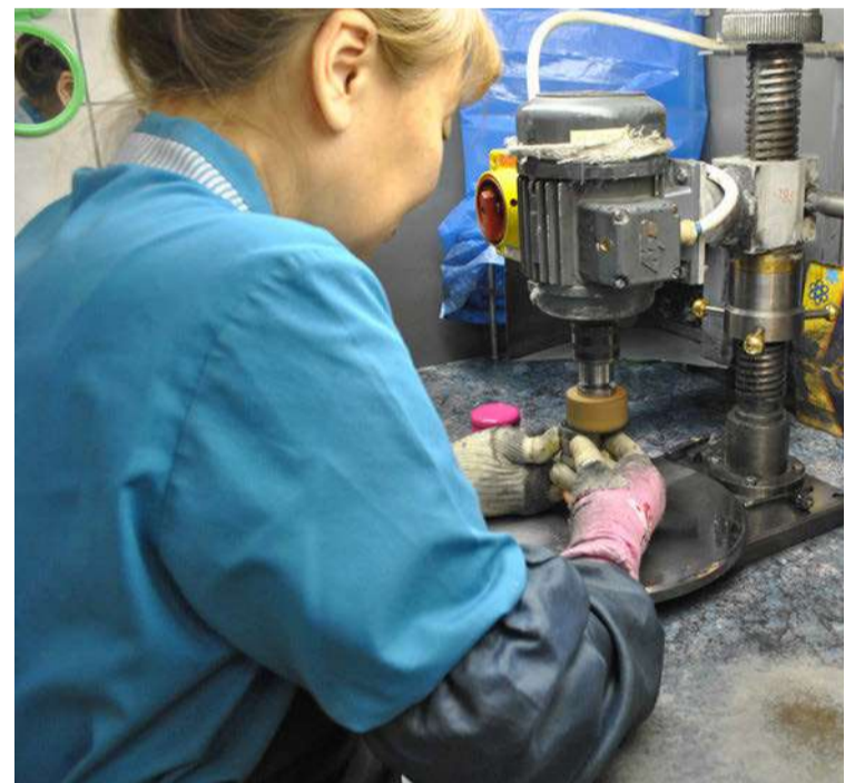
Полировка маточника будущей монеты

Теперь приступаем к воплощению задумки автора в металле. Но прежде нужно создать инструменты – маточник (оригинальный инструмент) и штемпель (рабочий инструмент). Первый создается на гравировальном станке. В оборудование загружается трехмерная модель, созданная в конструкторско-технологическом бюро. Тут важно вспомнить один из самых распространенных вопросов, долгие годы обсуждающийся в общественном пространстве: «Могут ли машины/роботы полностью заменить человека?» Ответ: однозначно нет. Гравировальный станок выполнил работу – перенес изображение на металл, но каким бы ни был уровень автоматизации изображение получившегося маточника несовершенно. Поэтому дорабатывает его вручную гравёр. Это те же художники. Но вместо карандаша у них штихель, а перед глазами микроскоп с многократным увеличением изображения.