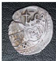
Рис. 10. «Черниговская» надчеканка (предположительно атрибутируется как монета Новосильского княжества)

В заключение статьи следует подчеркнуть, что такое решение вопроса, а именно возобновление пронской чеканки, позволяет пересмотреть атрибуцию отдельных групп монет переходного периода правления от в.к. Федора Ольговича Рязанского к его наследнику и снять многие накопившиеся противоречия.