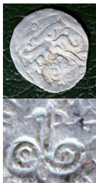
Рис. 6. Вид «якоревидной» пронской тамги

дение базируется на том, что пронская надчеканка с боковым отростком типа I «копировалась» с тамги в.к. Олега Ивановича – разветвленного стержня с завитками вверх и, вероятно, послужила основой для последующего преобразования в пронскую тамгу типа II (рис. 7). Проследим фазы трансформации более детально. Итак, пронские надчеканки типа I имеют две разновидности: