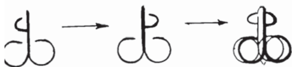
Рис. 7. Возможная трансформация пронской тамги из типа I в тип II

С 1370 г. Новосильский княжеский стол с помощью Дмитрия Ивановича Московского занимает Роман Семенович. Являясь союзником Москвы, он в 1375 г. участвует в походе на Тверь [10]. Его сын, князь Дмитрий Романович командует полком на Куликовской битве [11]. Отношения Рязани с Москвой до 1386 года недружеские. При таких обстоятельствах (даже тремя годами позже)