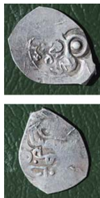
Рис. 11. Рязанско-Пронская монета 1408 г.