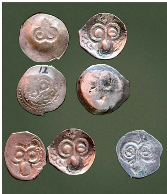
Рис. 13. Возможные экземпляры монет возобновившейся пронской чеканки