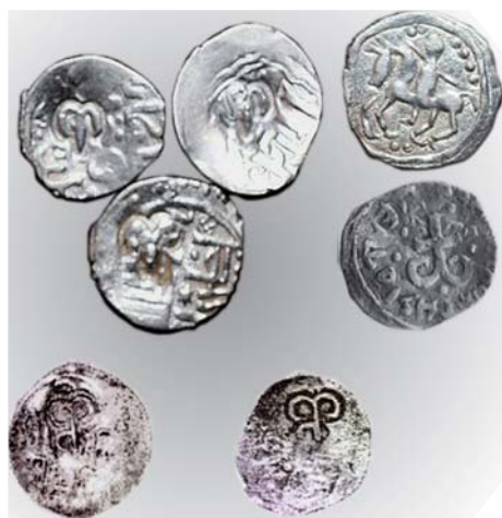
Рис. 3. Состав монет Алексинского клада

Что касается раскрытия смысловой нагрузки, которую несет так называемая Ф-образная тамга, то прежде необходимо определить, как смотреть на этот знак. Сходство надчеканки со славянской буквой «Ф» отметил А.И. Черепнин [7]. Его взгляд и предопределил вид пронской тамги как Ф-образной. Исследования последнего времени позволяют ее рассматривать «якоревидной», т.е. перевернутой на 180 градусов [8] (рис. 6). Это утверж-