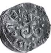
Рис. 8. Монеты Новгород-Северского и Стародубского княжеств