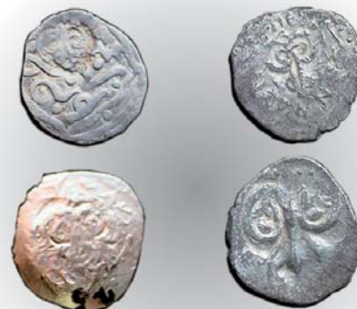
Рис. 2. Классификация монет Пронского княжества по П.А. Шорину