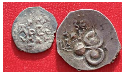
Рис. 12. Полуденга Пронского княжества